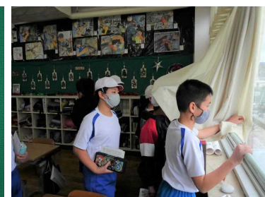
「あっ、雪が降ってきた！」（5年）