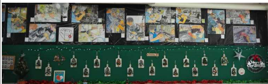
「僕らの町の手袋工場」と「ボードツリー」で教室の後ろがとてもにぎやかできれいです（5年）