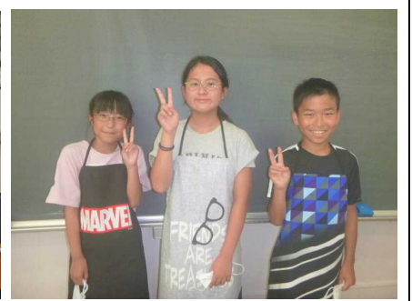
家庭科のエプロンができました（6年）