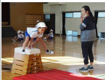
フォームがきれいです（1年）