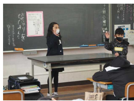
2学期を振り返る学級会（4年）