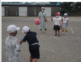
練習の成果が出ています（1年）