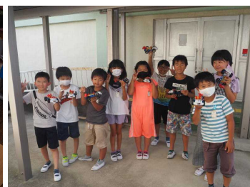
理科の実験、大成功（4年）