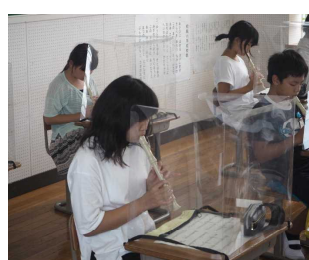
息がとても合ってます（6年）