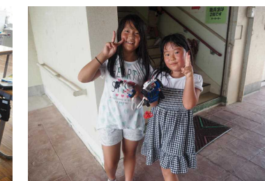
上手に走らせました（4年）