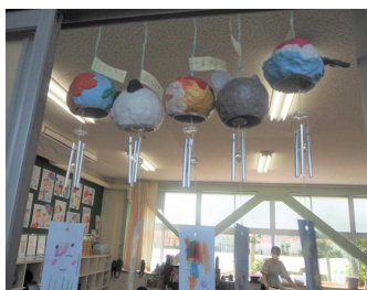
音色がとても涼やか（2年）