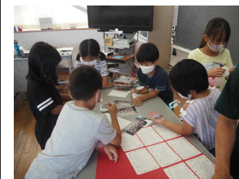
工場見学のお礼状を作成中（3年）