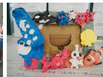
立体的な写真立て（3年）