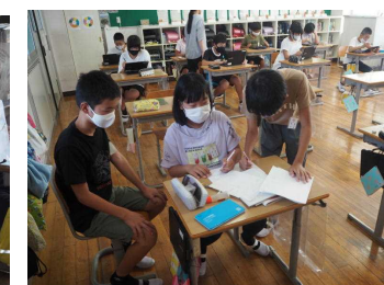
総合的な学習で調べ学習（6年）