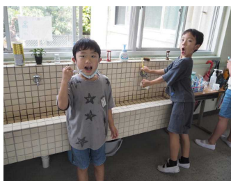
食後の歯みがき（2年）