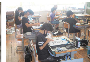
かなり集中しています（5年）