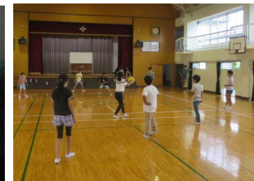
転校する友達と（5年）