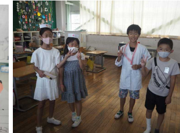
劇のリハーサル（4年）