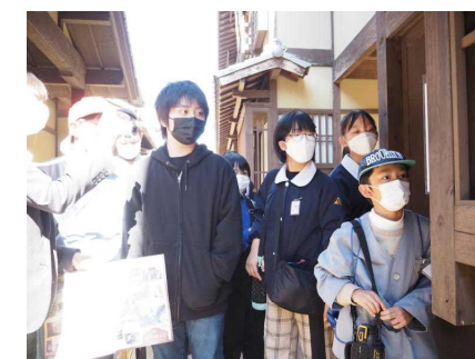
建物のセットがリアルです