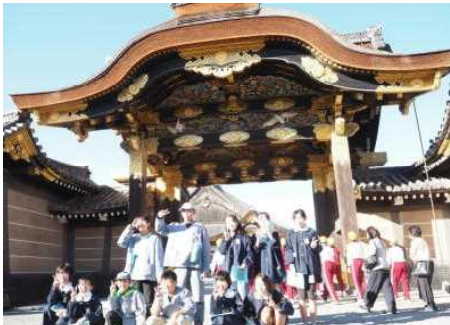
二条城 ウグイス張りはよく「鳴いた」