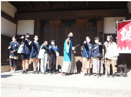
映画村の役者さんと決めポーズ