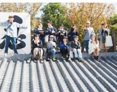
忍者の気分で「にん にん！」