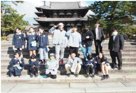
まずは法隆寺から。天候に恵まれみんなの笑顔が輝きます

3年ぶりに奈良・京都（宿泊先は滋賀）への修学旅行に行ってきました。6年生は歴史上の建物や人物、文化について学習した後の旅行となり、実際に目で見て心で感じるそれぞれの場面でした。また、東映太秦映画村では3つのグループに分かれて自分たちだけで行動。友情をさらに深め、集団生活としても規律ある行動ができた旅行でした。