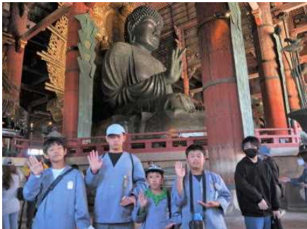
大仏さんもとても大きかった（15m）！