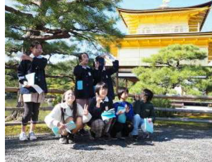
「昭和の大改修」を経て、まばゆいばかりの金閣寺