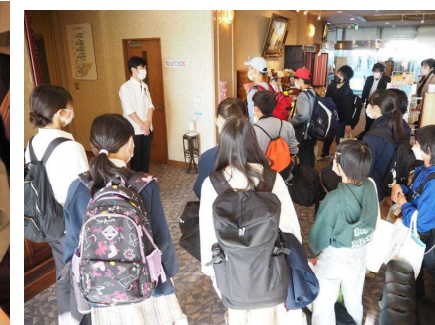
ホテルの方にお礼を言って出発