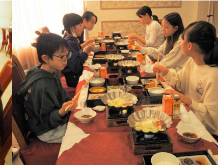
しっかり寝たのに眠そうな朝食