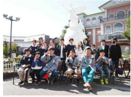
お陰様で良い旅となりました！