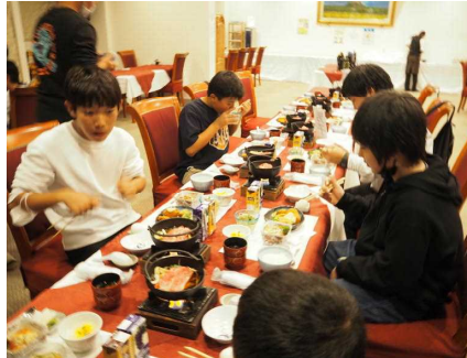
滋賀 おごと温泉の宿舎で夕食