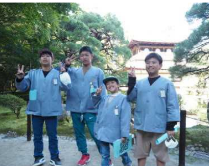
「わび・さび」を感じます