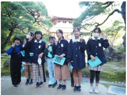
朝一番の銀閣寺 まだ人は少なかった