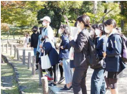
奈良公園 鏡池、きれいに写っている