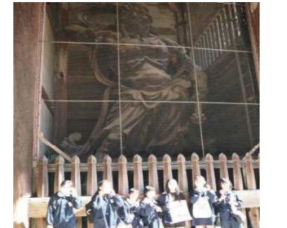
←「金剛力士像（仁王像）」