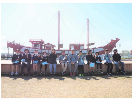
遣唐使船（レプリカ）、100人もの人が荒波を乗り越えて唐へ